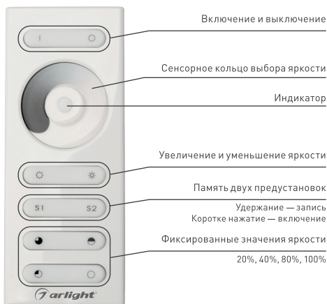
Рисунок 2. Назначение кнопок на пульте ДУ.

Чтобы привязать пульт к дополнительным диммерам проделайте операцию привязки для каждого диммера.